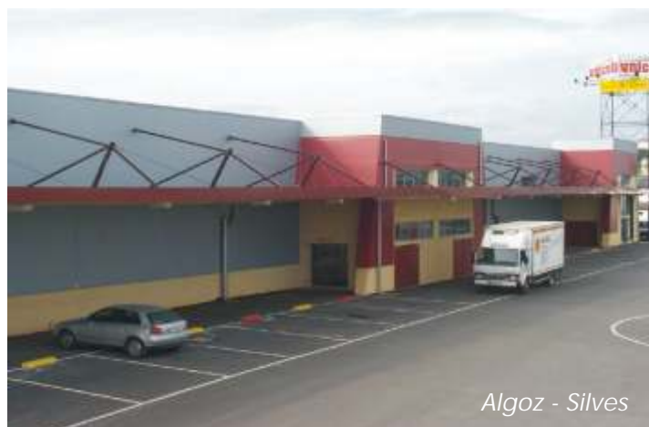
Algoz - Silves

A par desta expansão física com 4 cashs no Algarve, e o consequente aumento de volume de vendas, também os dirigentes da Unicofa no início desta década se preocuparam em sensibilizar os seus associados para a necessidade de modernizarem os seus estabelecimentos. Assim estudaram, criaram a imagem e o conceito, e deram início ao projecto Loja Fresca, que puseram á disposição dos associados que desejassem transformar as suas antigas Lojas Unicofa em modernas lojas de comércio, mais bonitas, atractivas, funcionais e por isso mais rentáveis. Cerca de 40 comerciantes associados aderiram ao projecto e aproveitaram do trabalho de criação da imagem comum Loja Fresca e do apoio técnico dado pelo Gabinete Loja Fresca que a Unicofa criou exactamente para informar, esclarecer, aconselhar e apoiar os associados a modernizarem as suas lojas radicalmente dando-lhes a imagem do grupo ou das novas Lojas UP ou ainda, para que, quem quer continuar a ter uma Loja Unicofa também tenham apoio técnico para