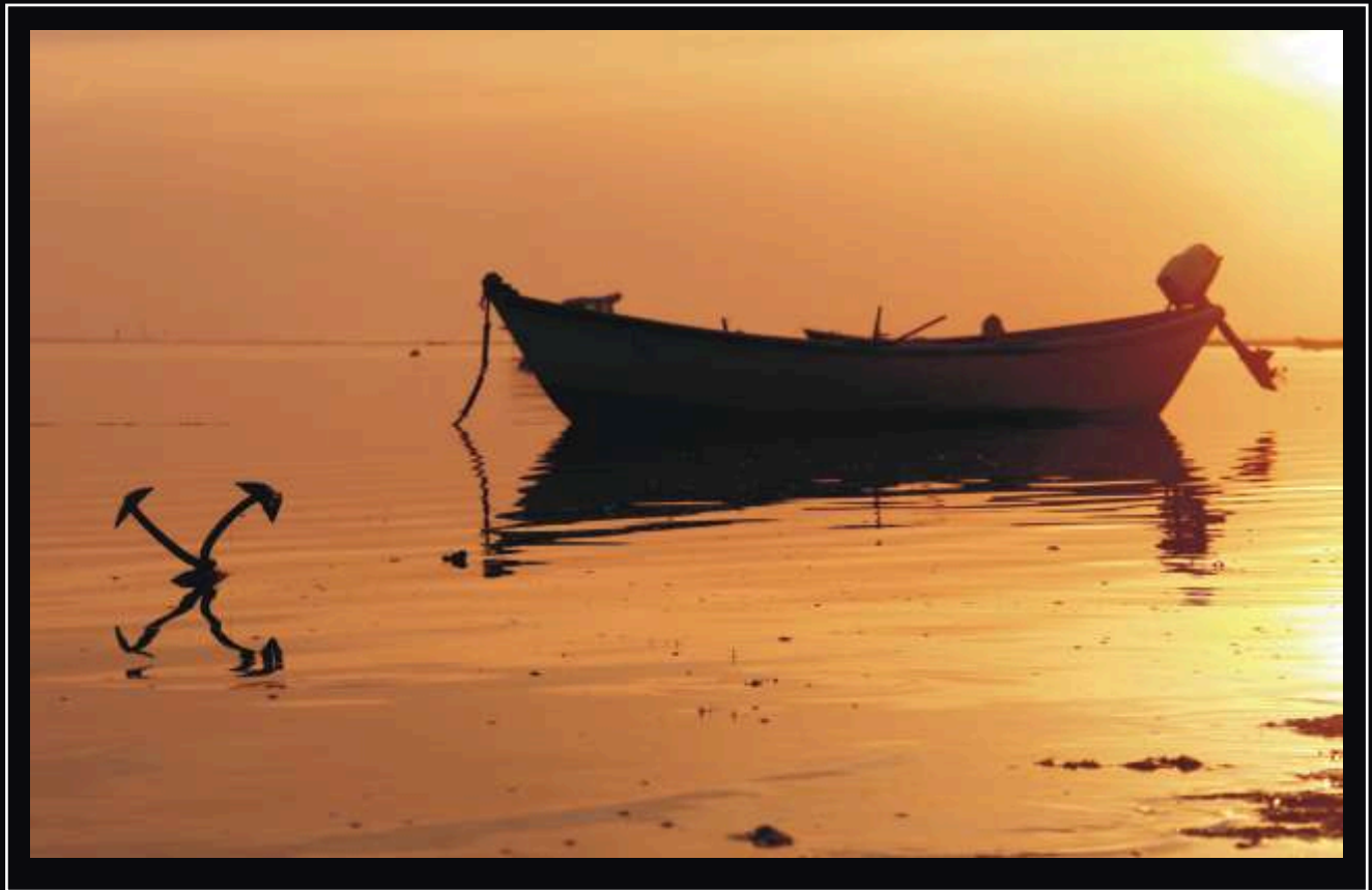
Autor: Carlos Neto