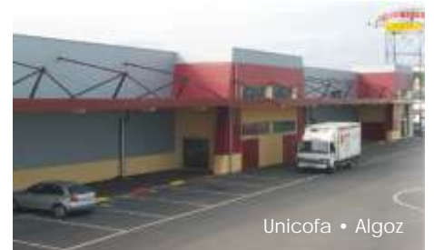
Unicofa • Algoz