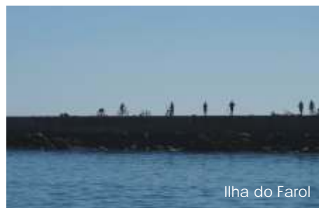
Ilha do Farol